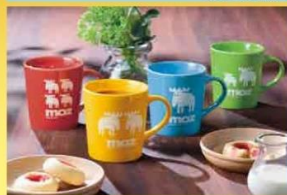
ティータイムが楽しくなる 色も形も魅力的なカラフルマグ