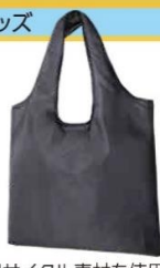
リサイクル素材を使用 肩掛けできてお買い物に 最適なエコバッグ