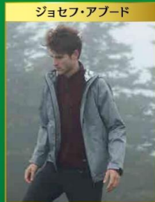
ジョセフ・アブード