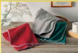
使う場所を選ばない ベーシックなブランケット