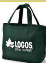
シンプルな ミニトートバッグ