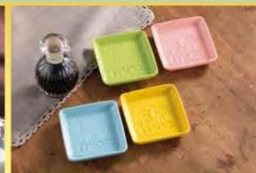
醤油を入れると エルクが浮かび上がる おうちごはん楽しい演出