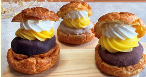
あんこと洋菓子の新しいコラボ