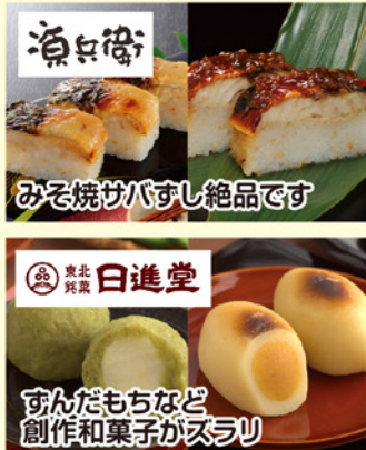
みず焼がバすし絶品です ずんだもちなど 創作和菓子がスラリ