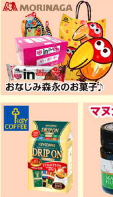
おなじみ森永のお菓子