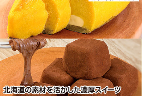
北海道の素材を活かした濃厚スイーツ