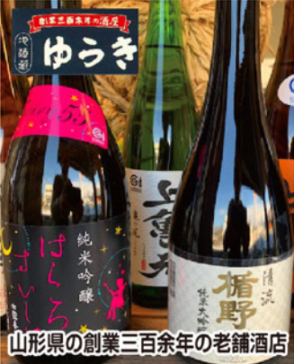
山形県の創業三百余年の老舗酒店