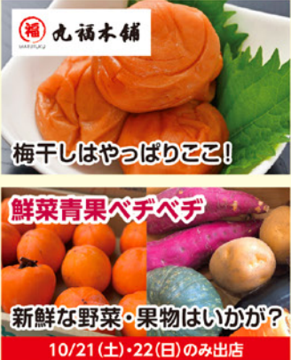
梅干しはやっぱりここ! 新鮮な野菜・果物はいかが?