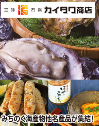
みちのく海産物他名産品が集結!