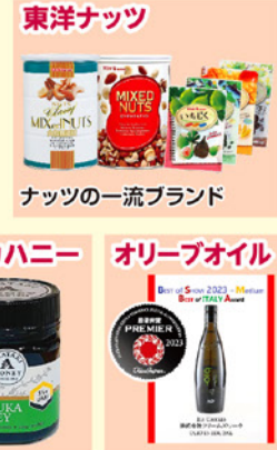
ナッツの一流ブランド マヌカハニー オリーブオイル

※出品店舗、商品、ブランドは変更になる場合がございます。 ※画像はイメージです。