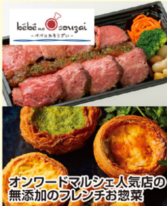
オンワードマルシェ人気店の 無添加のフレンチお惣菜