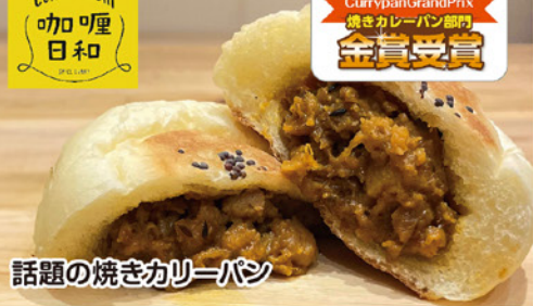
話題の焼きカレーパン