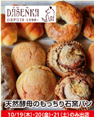
天然酵母のもっちり石窯パン